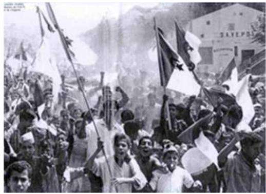
صور من مظاهرات 08 ماي 1945

التعليمة: اعتمادا على السندات (1)، (2)، (3) وعلى مكتسباتك القبلية اكتب فقرة من (10) أسطر تجيب فيها عن تساؤل أخيك.